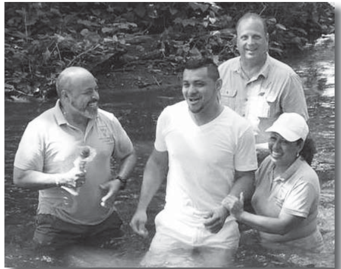
Las congregaciones de Towamencin y Centro de Alabanza compartieron un servicio de bautismos en el riachuelo Branch Creek.