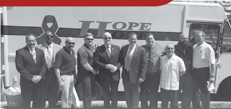
La congregación de Garden Chapel abrió sus puertas a líderes, orden público, y vecinos locales en el Condado Morris, NJ para un foro especial acerca de sustancias opioides y adicción.