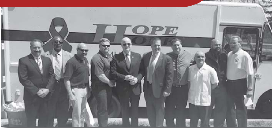
Jemaat Garden Chapel menerima para pemimpin, penegak hukum, dan warga sekitar di Morris County, NJ dalam acara khusus forum untuk para pecandu dan ketergantungan.