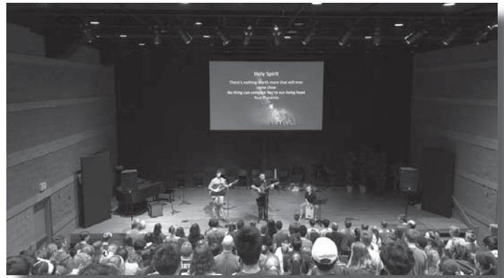
(arriba) La Academia Dock se llenó para la Fiesta de Secundaria Tarde en la Noche en donde 190 jóvenes de 15 congregaciones disfrutaron de los juegos, música, comida, y ánimo espiritual.